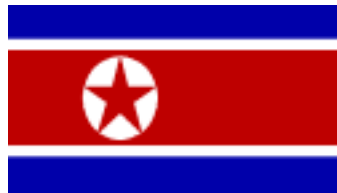
Bắc Hàn 1948