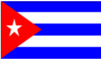
CuBa sau 1902