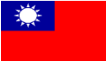
Trung Hoa 1868-1949