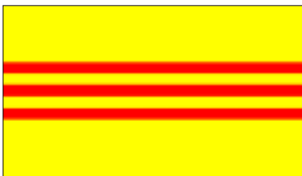
Việt Nam 1890-1920, 1948-1975