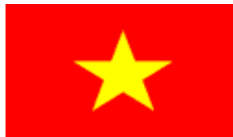
1955 hiện nay (*)

VIỆT NAM SAU CS CŨNG SẼ LÀ CỜ VÀNG BA SỌC ĐỎ