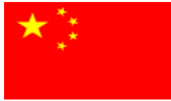
Trung Cộng 1948